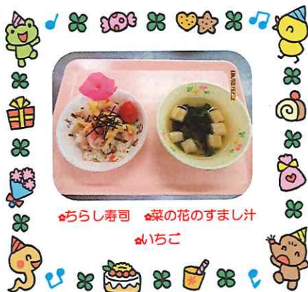
ちらし寿司 菜の花のすまし汁 いちご